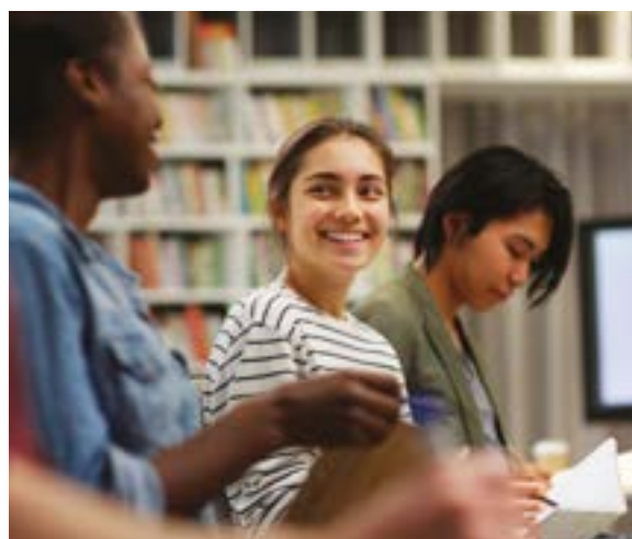
7 – PAARI, personnes Autistes pour une Autodétermination Responsable et Innovante

De manière générale, il existe des difficultés à maîtriser le processus de candidature et notamment l'entretien d'embauche. Les difficultés portent également sur la communication et l'interaction avec l'environnement de travail et l'intégration à la culture d'entreprise. Des barrières plus spécifiques à la France accroissent ces difficultés comme le manque d'informations, de sensibilisations et de formations du monde de l'entreprise comme du milieu spécialisé concernant les droits et moyens pour favoriser l'inclusion professionnelle des personnes autistes.